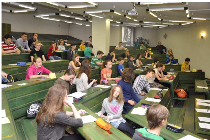
Pythagoriáda, 25.5.2016, Český Těšín

Mezi nejvíce zastoupené soutěže patří Mezinárodní matematická soutěž KLOKAN a KLOKÁNEK 2016. Soutěže se zúčastnilo 520 žáků.